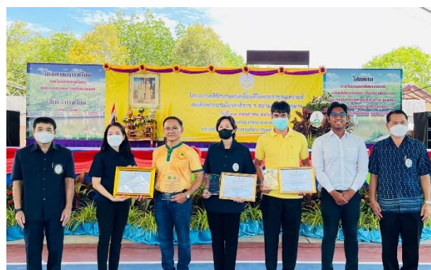
ภาพกิจกรรมการประกวด ศพก. ดีเด่น ระดับกรุงเทพมหานคร ปี พ.ศ. 2566