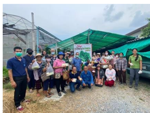
ภาพ: กิจกรรมจัดกระบวนการเรียนรู้ให้กับเกษตรกรผู้นำ จำนวน 120 ราย (พื้นที่ละ 30 ราย) ของกรุงเทพมหานคร ปีงบประมาณ พ.ศ. 2566