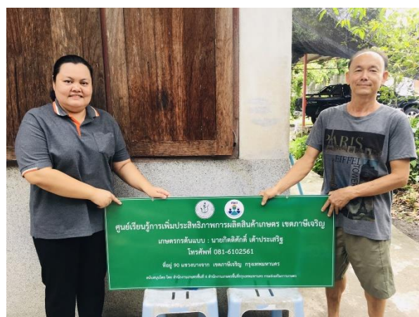
ภาพ การสนับสนุนวัสดุเพื่อพัฒนา ศพก. (หลัก) กรุงเทพมหานคร ปี 2566