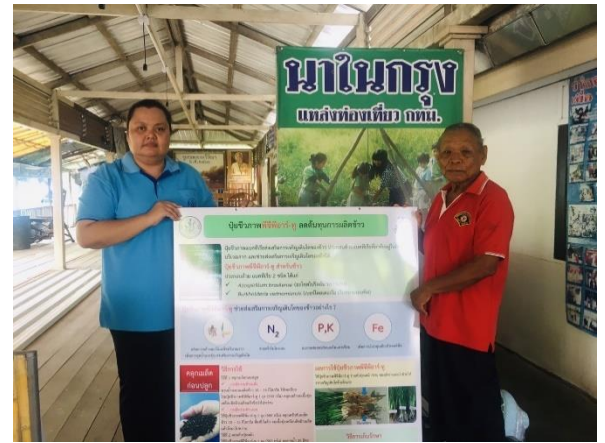
ภาพ การสนับสนุนวัสดุเพื่อพัฒนา ศพก. เครือข่าย กรุงเทพมหานคร ปี 2566